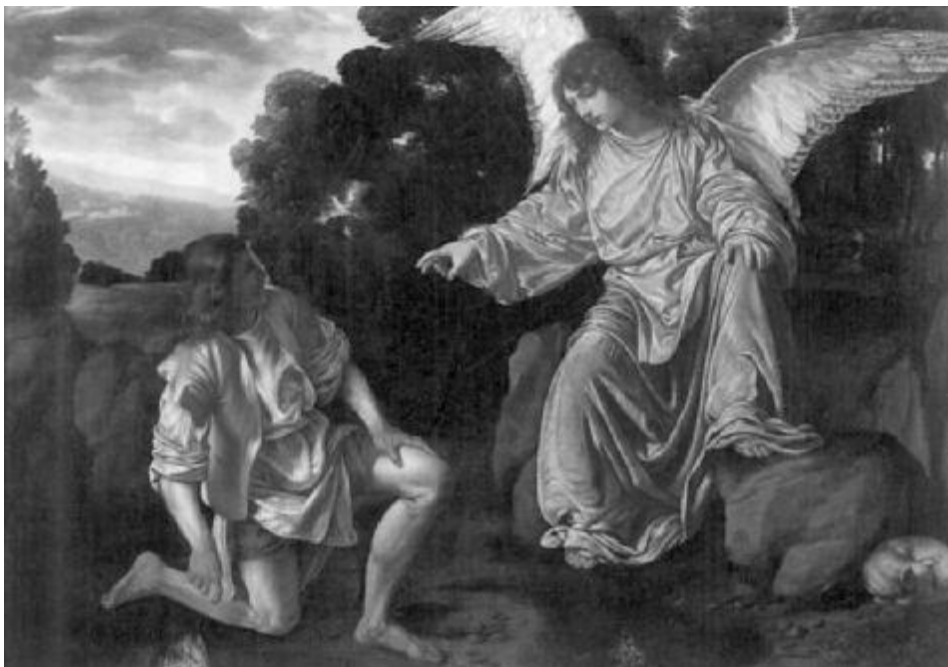
Girolamo Savoldo - Tobitolo e l'Angelo Roma, Galleria Borghese

i gesti, con una mano che posa per tutti e due sul ginocchio, e l'altra che trasferisce il gesto dell'angelo a Tobi, e da lui verso il pesce. Solo il volto di Tobi è in ombra, perché la luce è l'angelo dalle grandi ali splendenti e dal volto che irradia una serenità senza confini. Ma sintonie e dinamiche ci dicono che quello che Raffaele ha fatto per Tobi, Tobi può farlo per chiunque altro. "Se farete a gara nello stimarvi e nell'aiutarvi l'un l'altro, vivrete sulla terra una vita da angeli" ( Gregorio di Nissa ).