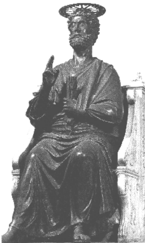
Statua bronzea di San Pietro Arnolfo di Cambio, Sec XIV - Roma

confronti delle persone omosessuali”. Come si fa a mettere d’accordo queste due affermazioni? Come si fa da una parte ad “affermare chiaramente il carattere immorale di questa unione” e insieme pensare che dire a due gay che si vogliono bene che il loro affetto è “intrinsecamente disordinato” equivalga a rispettarli e a non discriminarli?